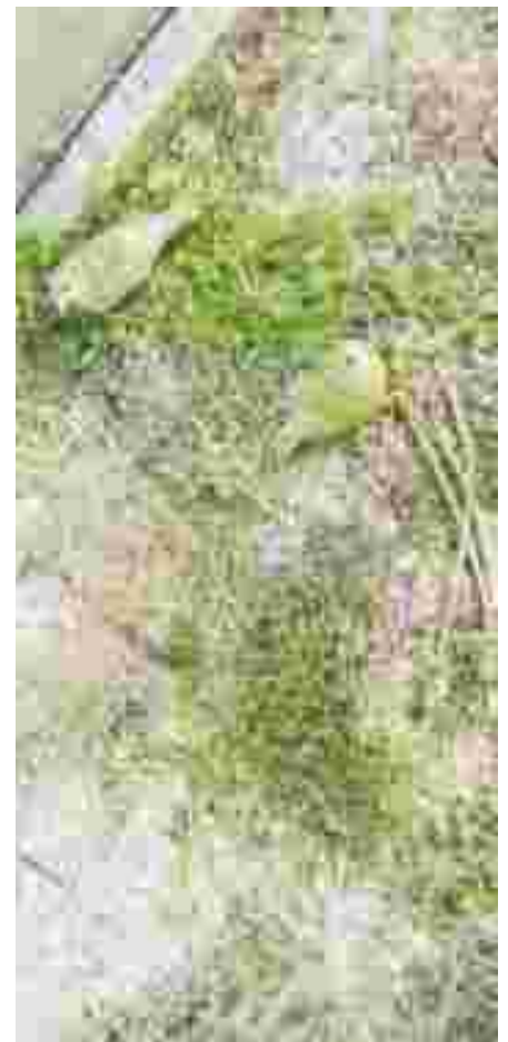
Una stupenda coppia di lucherini isabella pastello si ciba avidamente di foglie e semi di erbe prative.

Ci sono poi tantissime altre piante: delle quali gli uccelli si nutrono e che fioriscono nel corso dell'anno: la Piantaggine, la Borsa di pastore, la Camelina sativa, tutti i tipi di Cardo, la Poa trivialis, la Gramigna tanto per citare le più interessanti, ma il periodo più importante rimane la primavera e la nascita dei pullus per i quali almeno Centocchio e Dente di leone saranno indispensabili.