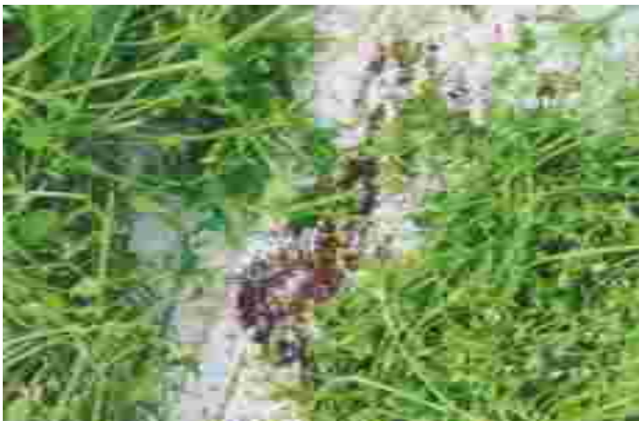
Semi prativi in essiccazione: Dall'alto a sx Bella di Notte, Dente di Leone e Centocchio. A dx piante di Cicoria Selvatica e Bella di Notte.

CONCORRENTI, PRESIDENTI DI FIERA, GIUDICI, IL 23 APRILE 2011 SIETE CHIAMATI TUTTI A SAN FIOR PER RICORDARE LA MEMORIA DI "GIANNETTO" AL QUALE E' STATA DEDICATA LA COPPA VENETO ED E APERTA A CONCORRENTI DI TUTTE LE REGIONI.