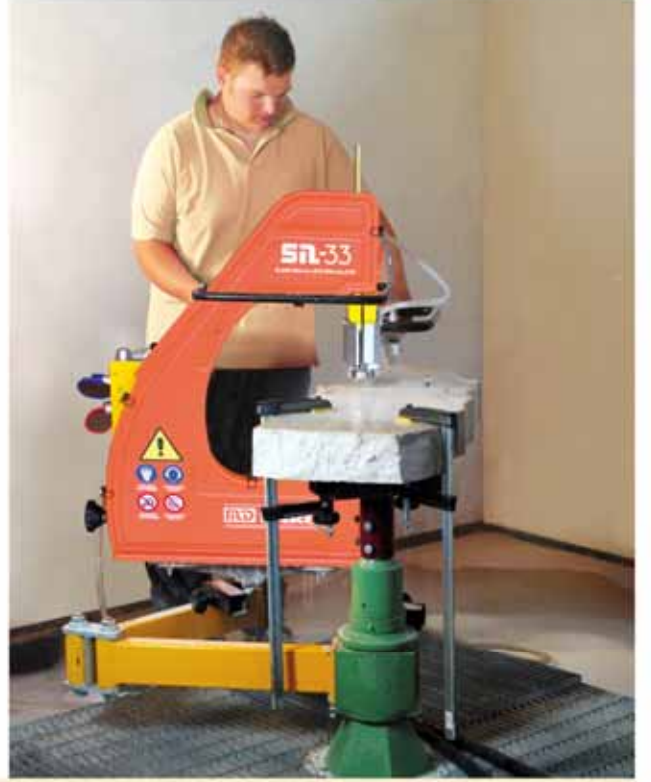
Yukardaki resim: Kürsü üzerine yerleştirilmiş SN33' lü SET 300.

İsteğe bağlı olarak 0° 'den 45° 'ye kadar eğimli kesimler gerçekleştirilebilmesi için makinayı düzenlemeye imkan sağlayan EĞİLEBİLİR DESTEK aksesuarı mevcuttur.