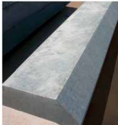
Yandaki resim: Otomatik ilerletme cihazı ve eğilebilir destekle donanmış SET 400' le gerçekleştirilmiş olan özel kesimler. ►