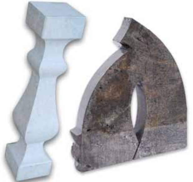
Üstteki resim: SET 400' le gerçekleştirilmiş çalışmalar – MANUEL VERSİYON.