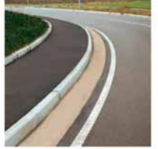
Yukarıdaki resim: Otomatik cihazlı SET 400 yanda: yol yapım çalışmaları.