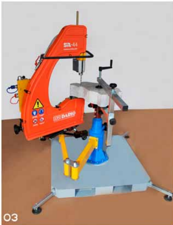
Yandaki resim: Kürsü üzerine yerleştirilmiş SN44' lü SET 300.

Hem SN33 hem de SN44 çok hassas bir kesimle küçük parçalar ( mozaik, küçük sanatsal parçalar, dolgunal ve objesel çalışmalar ) elde etmek istendiğinde tezgah üzerinde yapılacak çalışmalar için sabit olarak da kullanılabilme özelliğine sahiptir.